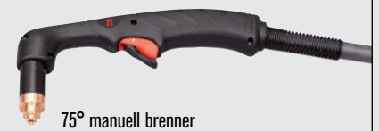
75° manuell brenner

(flere brennervalg finnes på www.hypertherm.com )