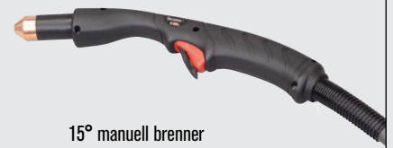
15° manuell brenner